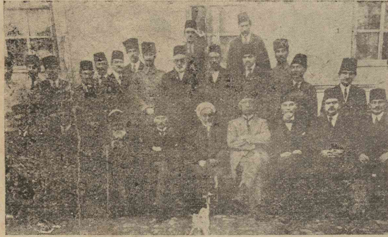
Ata Sivas kongresinde

Kurtuluşun yalnız milli teşekküllerle mümkün olacağı anlaşılınca şark vilayetlerimiz Erzurum Kongresini topladı. Fakat kardeşlerinin de