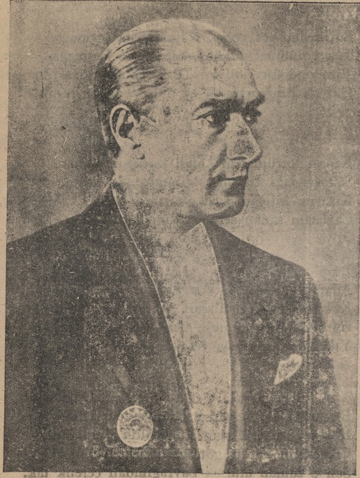
EBEDİ ŞEFİ ATATURK