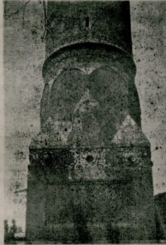
Melek Ahmed paşa camii mi nare kaldesindeki süslerden parça

çocuğu el, ele vererek çalışmağa koyuldular ; bir taraftan tarlalarını ekerken , öte taraftan ipekli kumaş ve Diyarbakırın harir şurubu üzerine ticaret yapmağa başladılar.