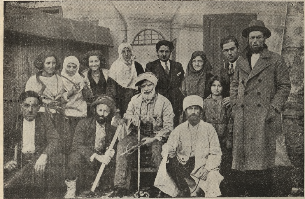
Geçen ay içinde Gösterit şubemiz tarafından temsil edilen Operetli Himmetin oğlu piyesinde rol alan arkadaşlar

Özet : Boyabat ensesine yaslanmış heybetli kayalıklar üzerine oturtulmuş olan tarihsel anıtlarile, kalelerle bu şanlı ve değerli Türk kentinin ebedi ve silinmez olan şanlı tarih sahifelerinin birer muhrudur.