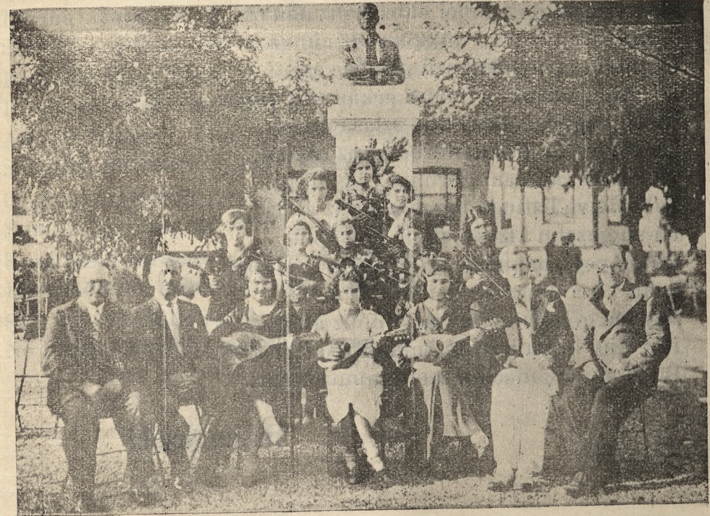
Evimizin Keman Kursundan Ders alan Talebelerinden Bir Gurub

Koy Dıranazın kolları arasında Dıranaz koyun kucağında.