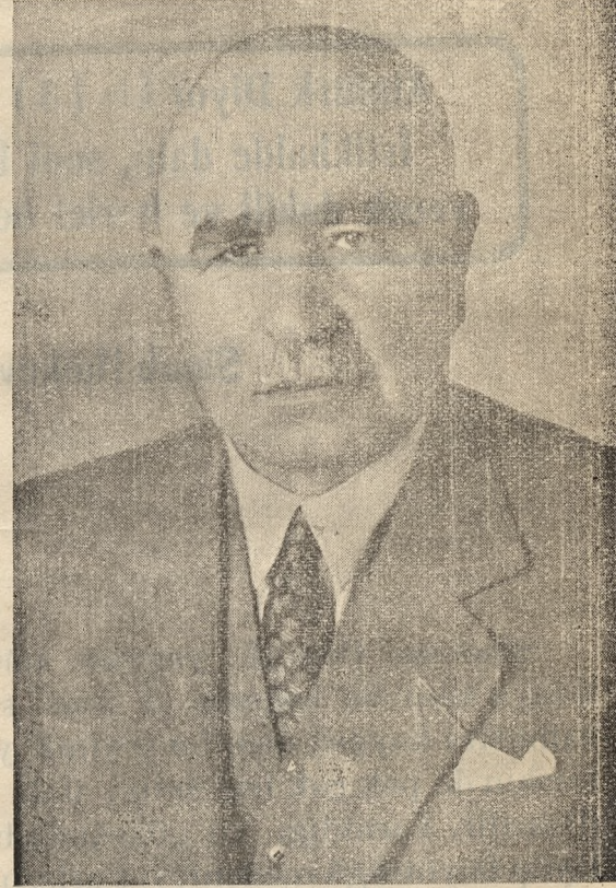
Yurdumuzu Çelik Ağlarla Süslemekte Olan Nafia Bakanımız Sayın Ali Çetinkaya

sının göz kamaştırıcı güzelliğine tapın! Eşsizliğine inanın!