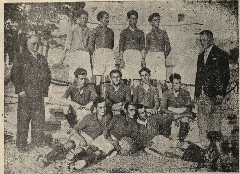
Evimizin Spor Kolu Gençlerinden Bir Takım

Bizden olan, bizim olan o köylü kardeşlere kurtarmak ellerimizi uzatmalı... Yaralarını sarmalı, emlerini (i ac) sarmeliyiz.