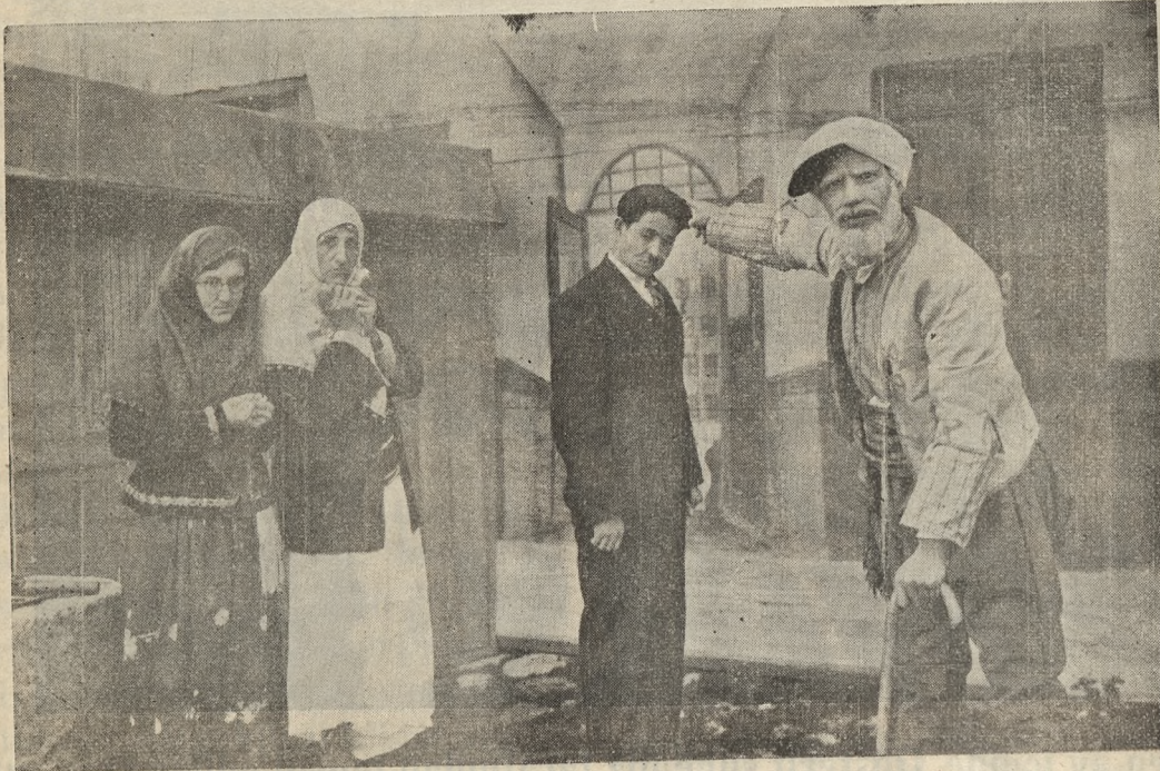
Himmetin oğlu Piyasından ikinci bir sahne